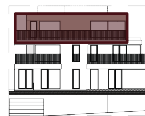
FACADE LATERALE GAUCHE