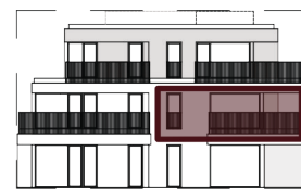
FACADE LATERALE DROITE